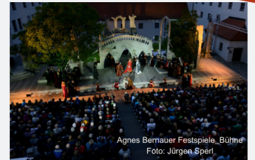
Agnes Bernauer Festspiele, Bühne

Arrangement 2: Nach der Stadtbesichtigung erwartet Sie ein 3-Gang Menü in Gasthaus nur wenige Gehminuten vom Schloss entfernt. Anschließend Besuch der Festspiele um 20:30 Uhr. In der Pause können Sie sich bei einem Getränk erfrischen.