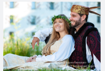
Agnes Bernauer Herzog Albrecht III