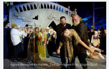
Agnes Bernauer Festspiele, Tod der Agnes